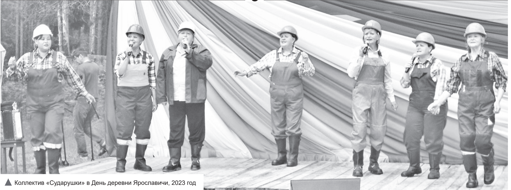
▲ Коллектив «Сударушки» в День деревни Ярославичи, 2023 год

городе, бабушки помогают, внуков устраивают в наш детский сад. Как с детьми в том же Питере? Или работой, или с ребёнком сиди. А встретить ребёнка из садика, школы? Здесь же все свои. Вместе всегда легче. Проблему с жильём тоже можно решить: идёт программа расселения ветхого жилфонда, есть программы для молодых семей. На будущий год в Винницах снова начнётся строительство многоквартирного дома, а кто-то бы и сам строился.