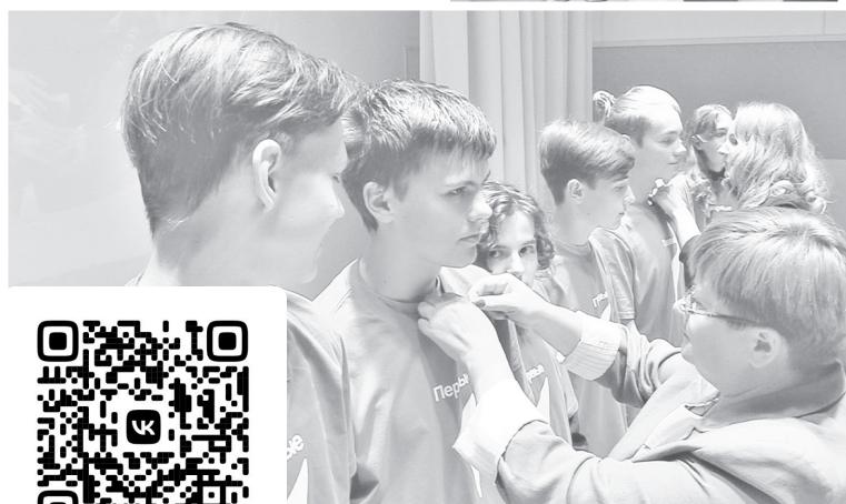
► Вручение значков «Движения первых»