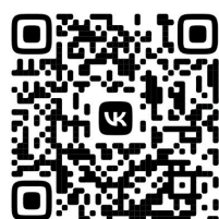
ВидеOVERсия ТК «СвирьИнфо»