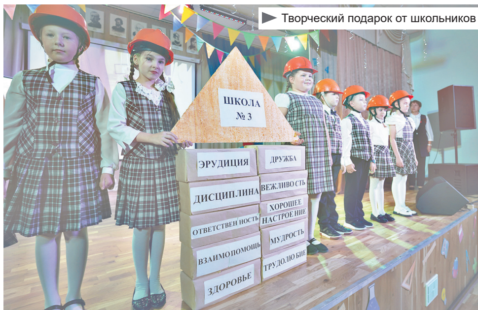
► Творческий подарок от школьников

Школа в свой день рождения была наполнена тематическими экспозициями, а основное действие праздника развернулось в актовом зале. На сцене ученики из кирпичиков построили здание родной «тройки», где каждый элемент имеет своё огромное значение, а именно: здоровье, трудолюбие, взаимопомощь, мудрость, хорошее настроение, ответственность, дисциплина, вежливость, дружба и эрудиция. Именно из этого состоит школьная жизнь Подпорожской школы № 3.