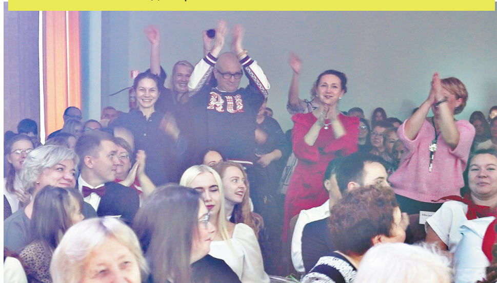
► На празднике организаторы отмечали выпускников разных десятилетий, призывая их встать и показать себя

Здание это строилось в спешном порядке: переезд в него хотели приурочить к 100-летию Владимира Ильича Ленина.