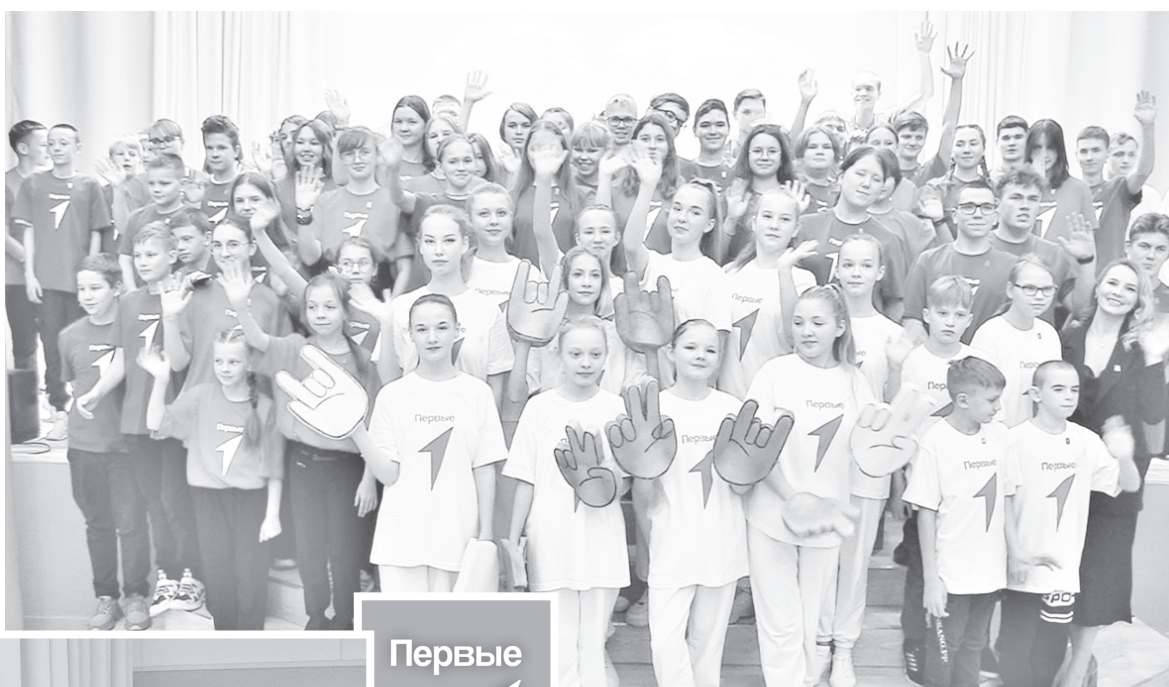
► Новые активисты движения