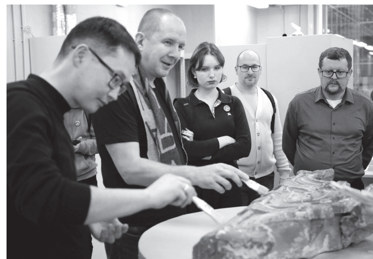
Участники форума посетили Международный центр реставрации в селе Рождествено

АЛЕКСЕЙ АСТАПЧИК ФОТО: АЛЕКСЕЙ АСТАПЧИК, МЕЖДУНАРОДНЫЙ РЕСТАВРАЦИОННЫЙ ЦЕНТР