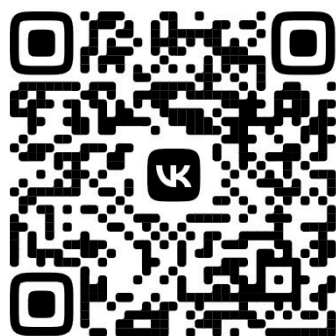
Видеоверсия ТК «СвирьИнфо»

Авторы не исключают, что со сборника «Репрессированное поколение» начнётся большой проект по изучению судеб наших земляков и насыщенной истории