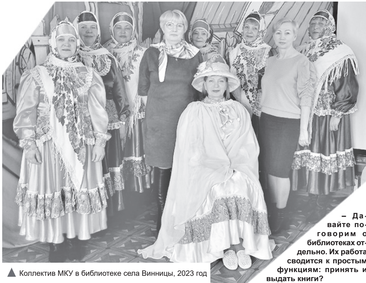
▲ Коллектив МКУ в библиотеке села Винницы, 2023 год

то вместе в школу ходил, кто-то вместе работал. Получается очень тепло, по-домашнему. Такой задушевной, камерной атмосферы на больших многолюдных праздниках невозможно создать. А её так не хватает в нашей суматошной жизни, может потому с каждым годом растёт число наших зрителей.