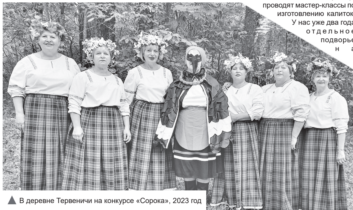
▲ В деревне Тервеничи на конкурсе «Сорока», 2023 год

Беседу вела Вера КЕМПИ