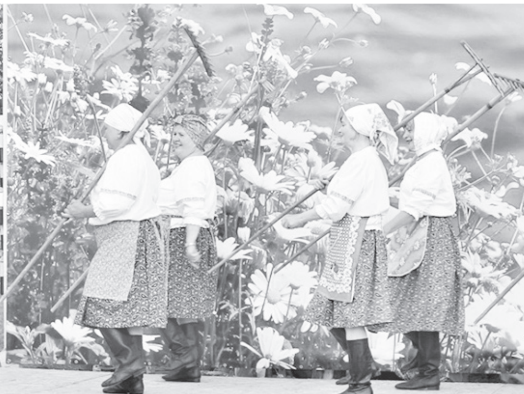
▲ Коллектив «Сударушки» в День деревни Ладвы, 2022 год