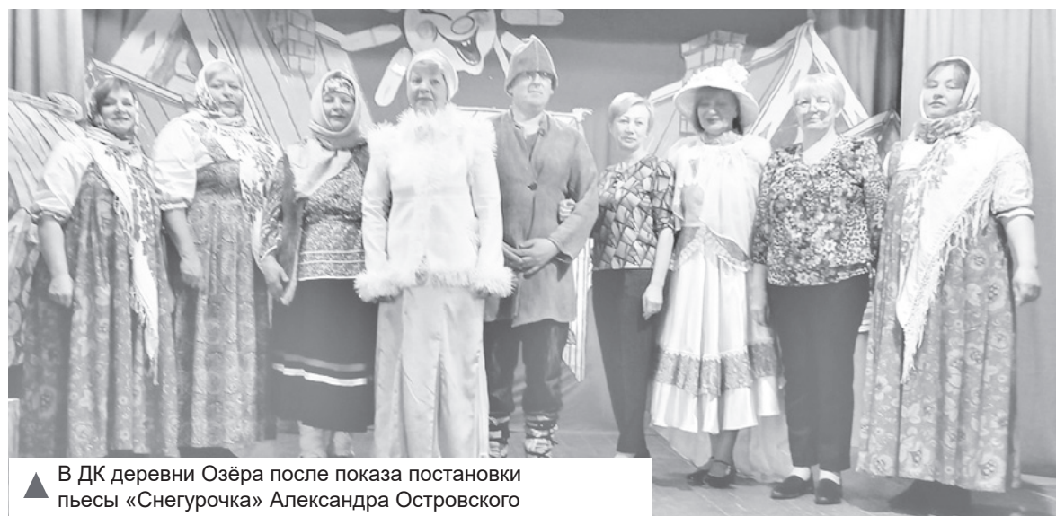
▲ В ДК деревни Озёра после показа постановки пьесы «Снегурочка» Александра Островского

Прижился у нас и День вепсской деревни. Праздник стартовал при поддержке Комитета по местному самоуправлению шесть лет назад. Каждый год мы проводим его в Озёрах, остальные деревни чередуются: в прошлом году была Ладва, в этом – Ярославичи, на будущий год планируем провести в Немже. Народу собирается до двухсот-трёхсот человек. Мы сами удивляемся, как с каждым годом растёт популярность Дня деревни. Наше объединение готовит программу, приезжают коллеги из других поселений и районов. Праздники проходят на улице, как «Древо жизни», только в миниатюре. Если в Винницы на вепсский праздник съезжается много незнакомых гостей, то в деревне собираются родные люди. Все друг друга знают: кто-