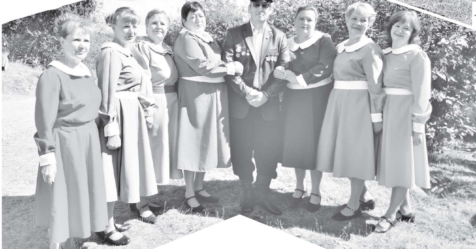
◀ Коллектив «Сударушки» в День деревни Немжи, 2021 год